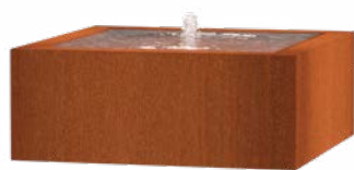
TABLE D'EAU CARRÉ CORTEN