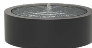
TABLE D'EAU RONDE ALUMINIUM