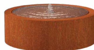
TABLE D'EAU RONDE CORTEN