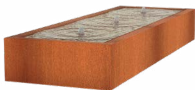
TABLE D'EAU CORTEN

Pour un aperçu complet de tous les modèles et des options spécifiques au produit, visitez www.adezz.com