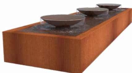
TABLE AVEC LES BOLS CORTEN