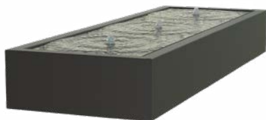
TABLE D'EAU ALUMINIUM